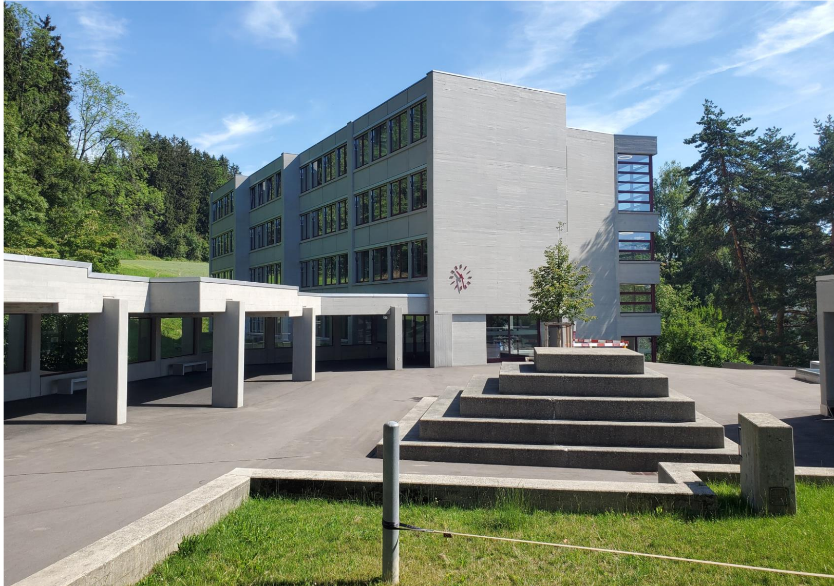
Betonsanierung mit dezent pigmentierter Lasur