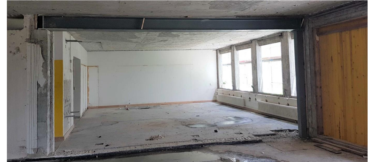
Abfangkonstruktionen bei räumlichen Anpassungen