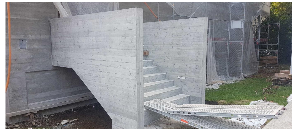
Neue Fluchttreppe im Aussenbereich mit Sichtbeton in Schalbrettstruktur