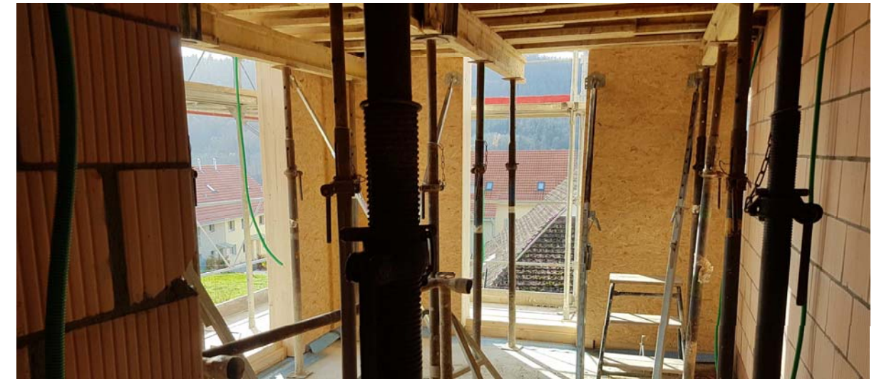
Hybridbauweise mit tragenden Holzelementen