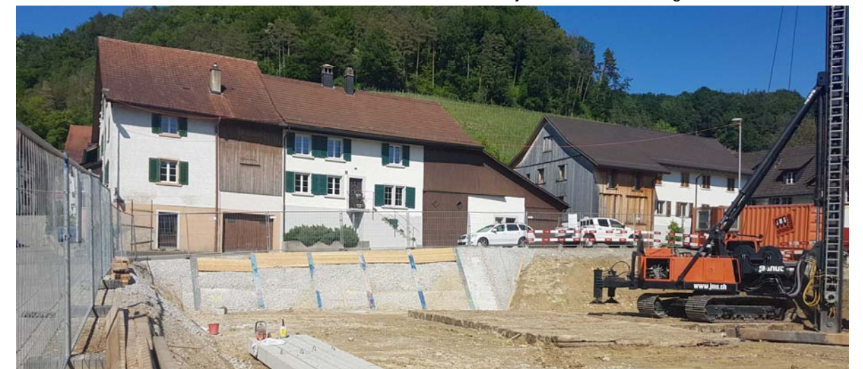
Aushub mit geböschter Baugrube, lokaler Baugrubensicherung und Pfahlfundation

Objekt: Neubau Alterswohnungen und Gemeindeverwaltung Dättlikon Beschrieb: Neubau von 10 Alterswohnung und Räumlichkeiten für die Gemeindeverwaltung Dättlikon. Geböschte Baugrube mit lokaler Baugrubensicherung, Pfahlfundation mit Rammpfählen. Massivbauweise mit tragender Holzfassade (Hybridbauweise). Fassade aus Holzelementen wurde im Wechselspiel mit den Baumeisterarbeiten hochgezogen. Erschliessungszonen mit eingefärbtem Sichtbeton. Sämtliche Aussenflächen in Sichtbeton mit vorgegebener Schaltafelstruktur. Bauherr: Alterswohnungen Dättlikon AG, Dättlikon Architekt: Oes Architekten AG, Winterthur Auftragsart: Direktauftrag Ausführung: 2020 - 2021 Unsere Leistungen: Tragwerksplanung Hochbau inkl. Hybridfassade. Planung Baugrube und Fundation. Planungspartner Holzbau: Krattiger Engineering AG