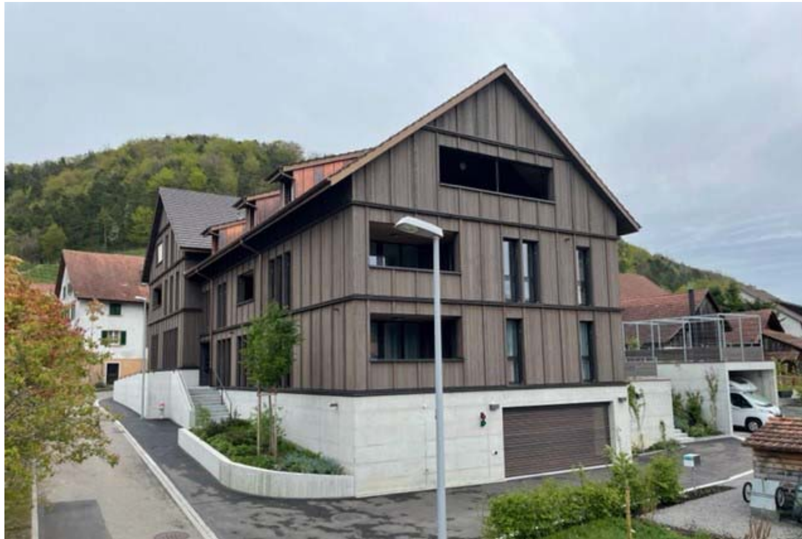
10 Alterswohnungen und Räumlichkeiten für die Gemeindeverwaltung