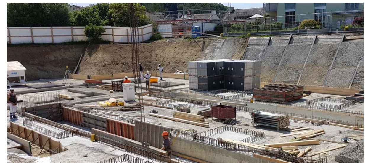
Baugrube mit Baumeisterrühlwand

Planung Tragwerk, Fassadenelemente und Baugrube