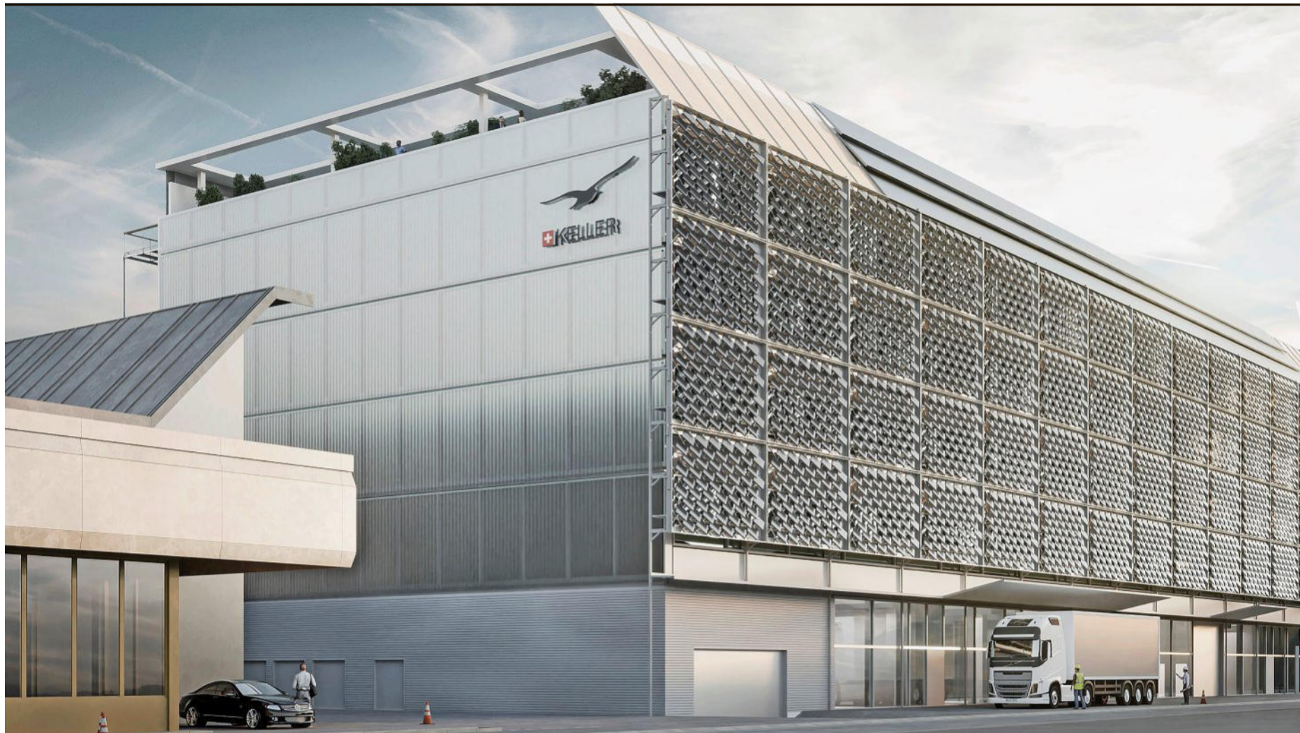
Liefere künftig 65 Prozent der Energie für die Produktion: Die schwenkbaren Fotovoltaik-Panels an der Fassade des neuen Produktionsgebäudes. Visualisierung: Strut Architekten