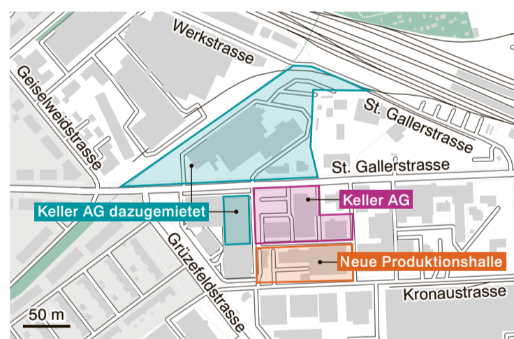
Grafik: mast, mat

Löten der Elektronik und das Prüfen in den Öfen. Mit ihren 450 Angestellten und einem Jahresumsatz von 90 Millionen Franken ist die Keller AG heute eine der grösseren Arbeitgeberinnen in der Stadt. Das solle auch so bleiben, sagt Keller. Dies, obwohl die Firma zuletzt ins Blickfeld grösserer Techfirmen geraten ist und es offenbar regelmässig zu Übernahmeangeboten kommt. Doch ein Verkauf sei kein Thema. Die Arbeitsplätze sollen langfristig in Winterthur bleiben.